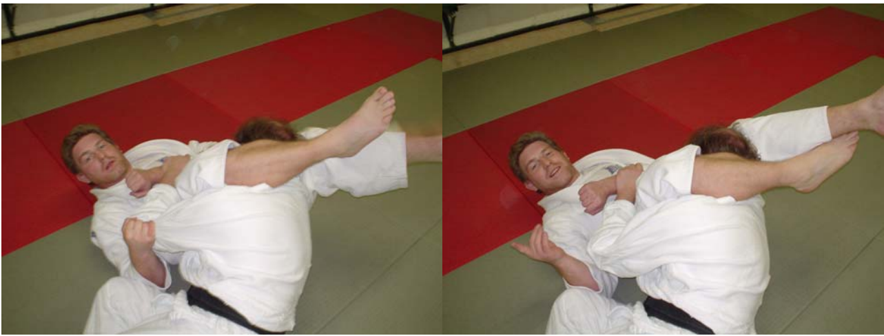
JUJI-GATAME inkomen 2