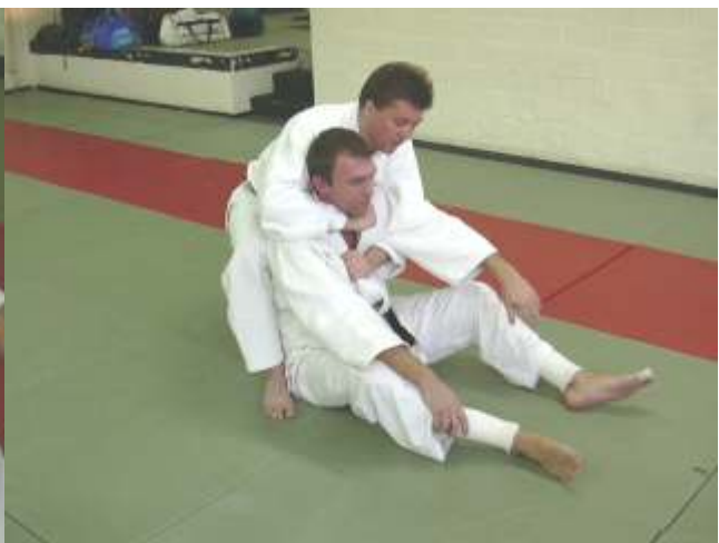
TORI verneemt met zijn linkerhand naar UKE's rechterrever.