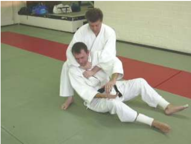
TORI draait zijn bovenlichaam naar rechts en zet de verwurging aan.